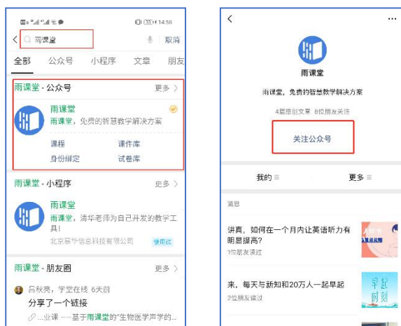
图 1 关注“雨课堂”